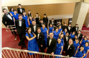
舞台監督: 幸泉浩司(アートクリエイション) 照明: 稲葉直人(A.S.G) 音楽スタッフ: 根本卓也

1989年に神戸市が設立した、日本では数少ないプロフェッショナル合唱団。密度が高く澄みきった美しいハーモニーは高い評価を得ている。ラトヴィアの室内合唱団「アヴェ・ソル」とは姉妹合唱団協定を締結した。神戸文化ホールの特属団体であり、年に2回の定期演奏会のほか、姉妹団体である神戸市室内管弦楽団との合同演奏会も行う。音楽監督・佐藤正浩とともにさらなる飛躍に努め、文化振興や社会公益活動にも注力している。