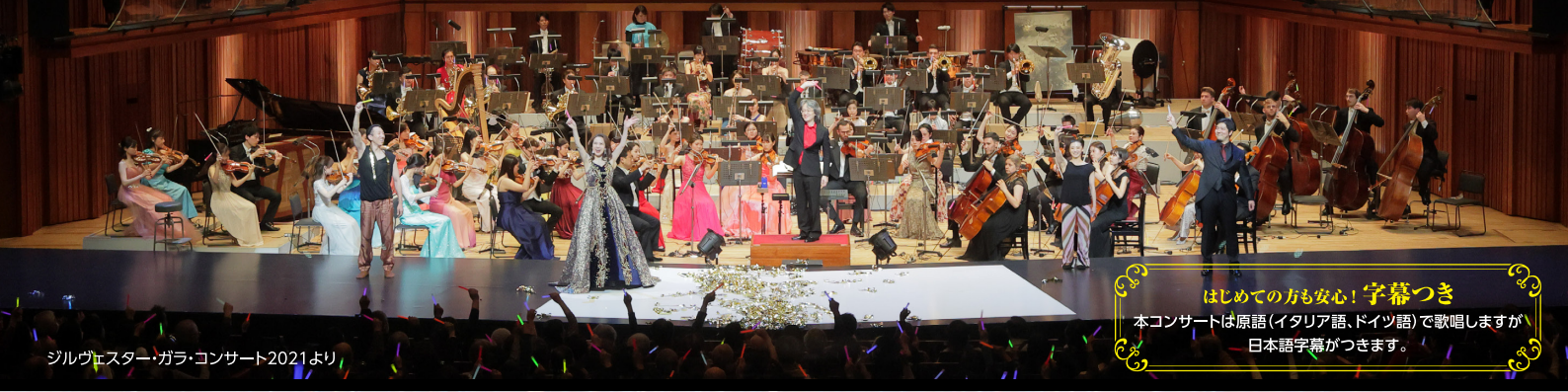
ジルヴェスター・ガラ・コンサート2021より

はじめての方も安心! 字幕つき 本コンサートは原語(イタリア語、ドイツ語)で歌唱しますが、日本語字幕がつきます。